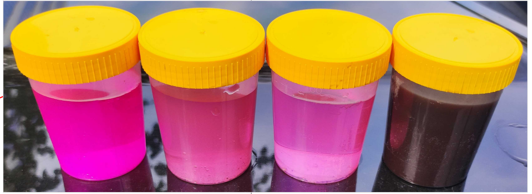
Piki czarna. Pienas z prawej osłabła potrawa ze spustu PCU-K2.

WODA LODOWA - ZASILANIE KLIMATYZATORÓW - PROWADZĆ W SIFIE PODWIESZANYM WODA LODOWA - POWRÓT Z KLIMATYZATORÓW - PROWADZĆ W SIFIE PODWIESZANYM PWL-C - PION WODY LODOWEJ - ZASILANIE CHŁODNICY KANAŁOWEJ-1 H=6.10 RZĘDZA DWA RURY Z DYLACJĄ